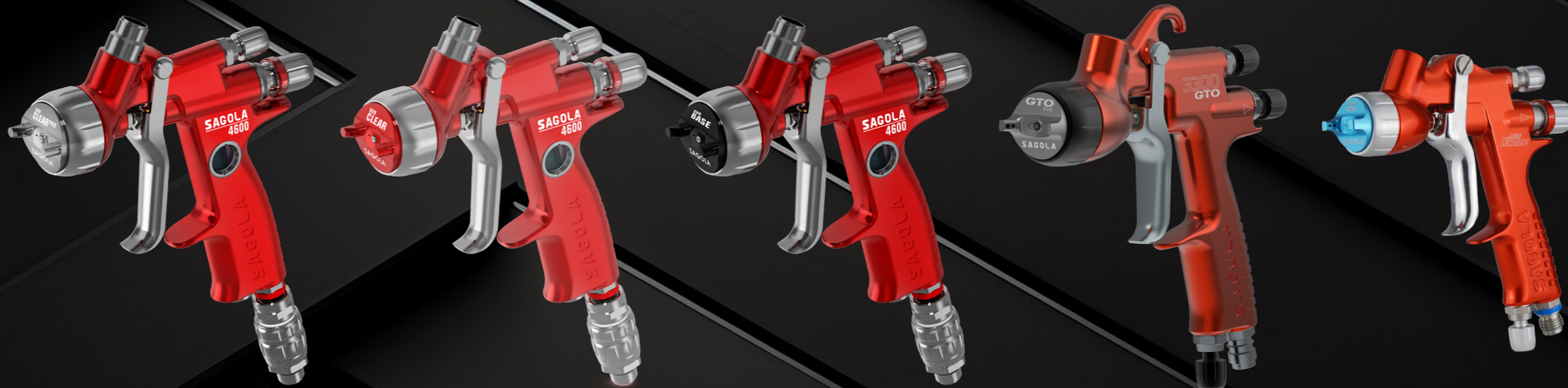
DVR CLEAR PRO SAGOLA 4600