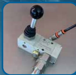
Válvula de acción manual