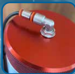
Entrada de aire comprimido